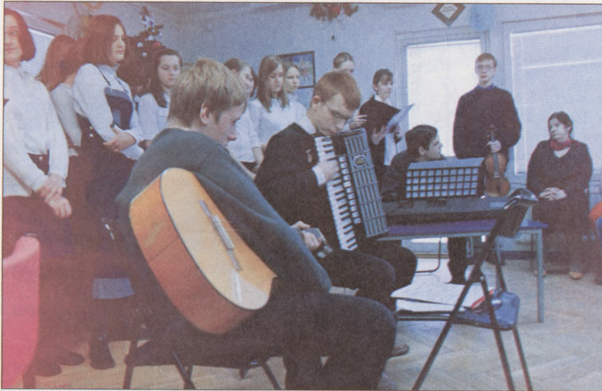
Zespół „Cantemus” podczas występów w Klubie Edukacji Samorządowej.

Zespół „Cantemus” śpiewa na apelach i uroczystościach szkolnych. W