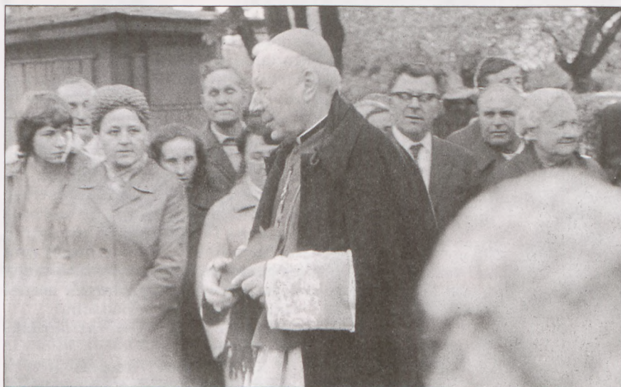
Wizyta prymasa Wyszyńskiego w Gołąbkach w 1973 roku.

Natomiast po 10 latach od poprzedniej wizyty, w sobotę 22 maja 1976 r. o godz. 17.00 prymas Polski ks. kardynał Stefan Wyszyński