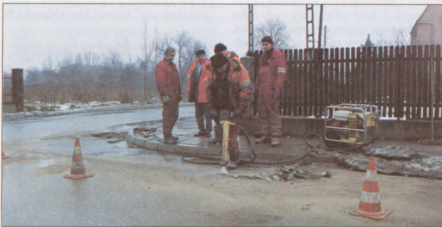
Prace prowadzone przez firmę „Efekt” na ul. Laskonogiego.