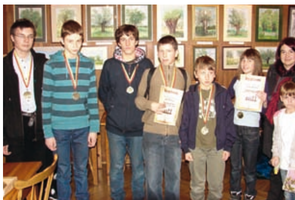
Grupa wyróżnionych młodych szachistów, uczestników cyklu zawodów „Smerfografie 2010”