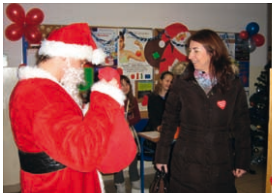
Czynny udział w pomnażaniu wpływów na Wielką Orkiestrę Świątecznej Pomocy miał św. Mikołaj

Uczniowie obu prywatnych placówek zaprezentowali noworoczny koncert, śpiewając piosenki, ja-